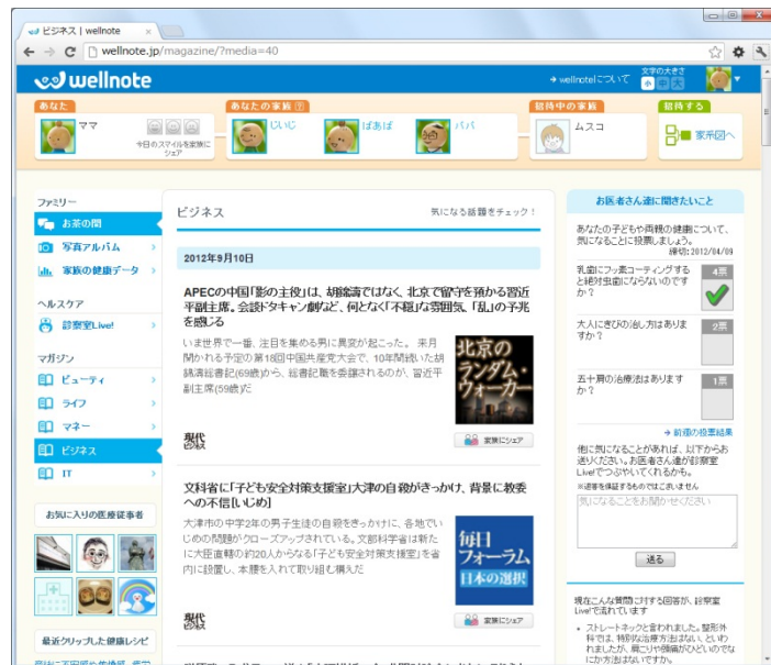
iPhone 版、PC 版画面イメージ